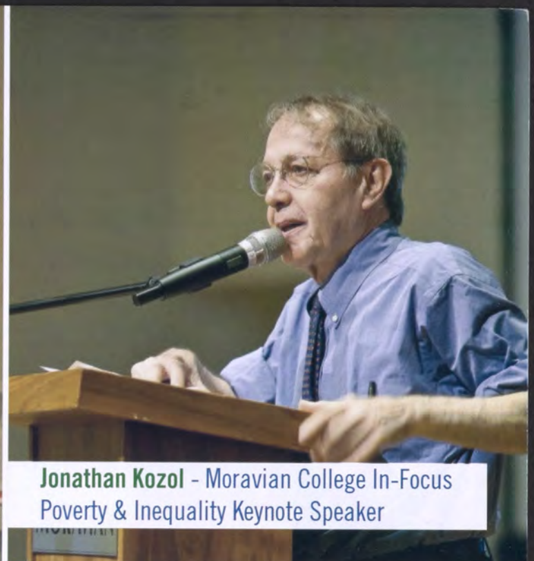
Jonathan Kozol - Moravian College In-Focus Poverty & Inequality Keynote Speaker